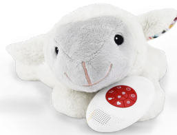
Liz the lamb