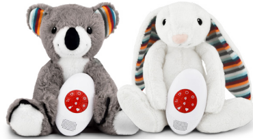
Coco the koala Bibi the bunny