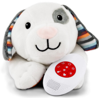
Dex the dog