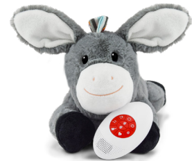
Don the donkey